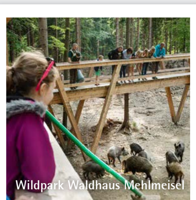
Wildpark Waldhaus Mehlmeisel